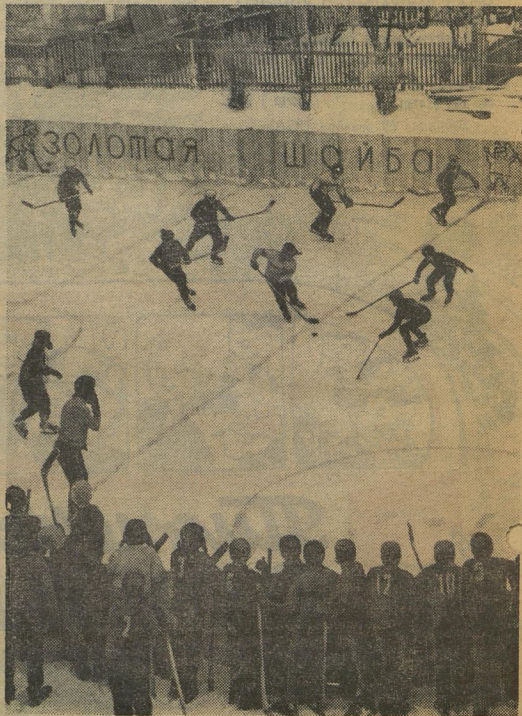
Если ты играл когда-нибудь в хоккей, то, конечно, знаешь, как тяжело бывает пробиться с шайбой в зону соперника. Свою линию зорко охраняют защитники. Вот где часто происходят столкновения. Таная уж игра — хоккей! Нужно не только искусно владеть клюшкой, хорошо натренироваться на коньках, метко стрелять по воротам. Настоящий хоккеист не имеет права бояться столкновений. Видите, как смело ринулись защитники на охрану своей зоны. Такая уж игра — хоккей!

Играют команды «Орлёнок» и «Союз» города Тольятти.